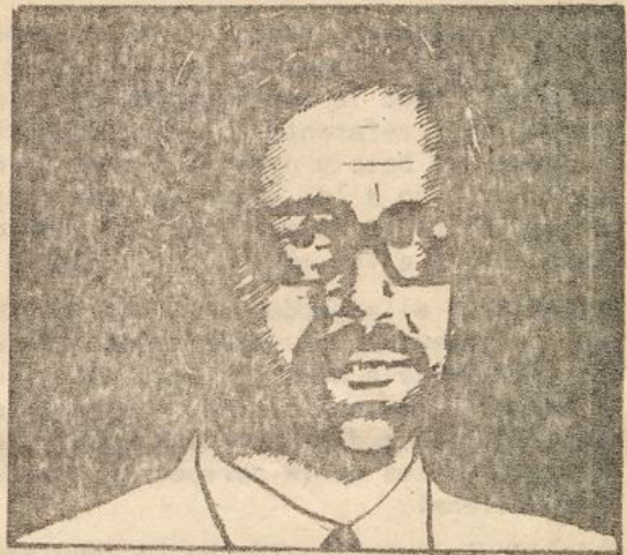
ANDRES PASCAL ALLENDE SECRETARIO GENERAL DEL MIR

La unidad se forja sobre todo en la lucha. Por ello saludamos el espíritu compartido por nuestros militantes y los avances logrados por nuestros partidos en la coordinación de sus esfuerzos de lucha contra la tiranía. Esos esfuerzos de acción común han contribuido decisivamente al impulso de las recientes movilizaciones de masas ofensivas y a la activa agitación antidictatorial en diversas regiones del país. El propósito de esta carta es justamente estimular la unidad y el fortalecimiento de acción común entre nuestros partidos y el conjunto de la izquierda que se manifieste en un plan de lucha que potencie las acciones de masas imprimiéndoles un carácter rupturista, integrando a todos los sectores so-