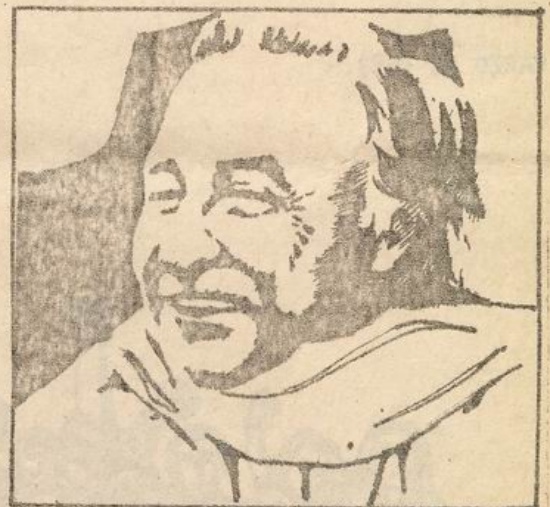
LUIS CORVALAN SECRETARIO GENERAL DEL PC