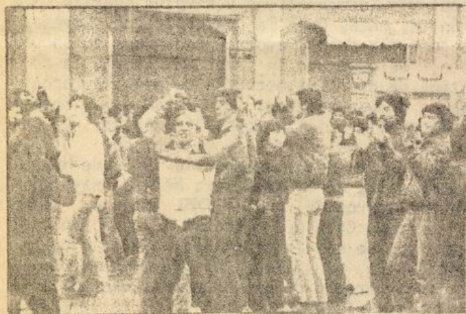
MANIFESTANTES EN EL CENTRO DE SANTIAGO

Ni las amenazas dictatoriales ni la represión impidieron que cientos de manifestantes salieran a la calle el 1º de Mayo, en la capital, respondiendo al llamado de la CNS y de otras organizaciones para reunirse en la Plaza Artesanos. Desde allí marcharon, puño en alto, gritando consignas que llamaban al paro nacional. El ataque de efectivos de seguridad vestidos de civil que golpearon a hombres, mujeres y niños recibió una amplia condena. La Unión de Reporteros Gráficos identificó a los agresores como carabineros de la 9a. Comisaría. Los manifestantes siguieron realizando mítines en la Plaza Prat, en Plaza de Armas y en los Paseos Ahumada y Huérfanos. La Catedral Metropolitana fue ocupada por un centenar de personas que durante 2 horas gritaron consignas contra el gobierno. Casi la totalidad de los 78 detenidos quedaron más tarde en libertad.