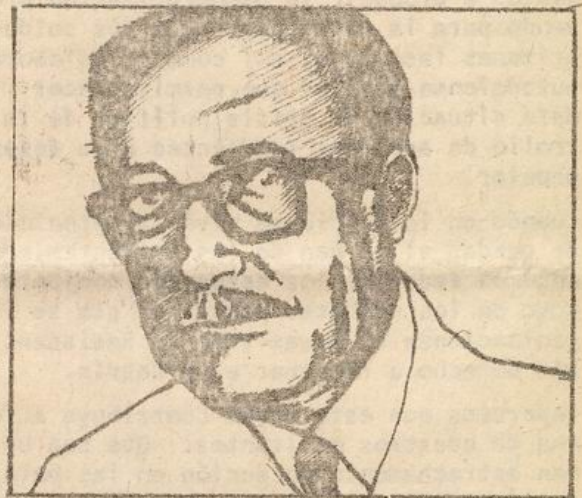
CLODOMIRO ALMEYDA SECRETARIO GENERAL DEL PS